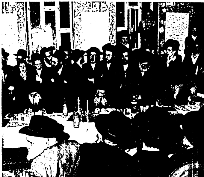
כ"ק האדמו"ר שליט"א בבית המדרש דחסידי קארלין

לפנות ערב עם גמר ההילולא התקיימה סעודת מצוה רבתית בראשות כ"ק האדמו"רים שליט"א באולמי בנות ירושלים ששולב עם סיום המשניות, בה נטלו חלק גם קהל גדול מבני ירושלים שזכו להנות ממנו עצה ותושיה ולהתענג על זיוו, אור קדושתו ותפארתו,